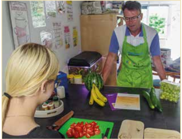
Texte und Fotos: T. Ehlers

Seit zehn Jahren ist die Kinder-Mahl-Zeit ein Ort, an dem Kinder eine gesunde Mahlzeit erhalten und ganz nebenbei erfahren, dass Essen mehr ist als satt werden: Es ist gemeinsames Erleben, Gespräch und Miteinander. So lernen sie, dass eine Mahlzeit auch etwas Soziales hat und Gemeinschaft schafft. Gerade für Familien ist dieses Angebot eine wichtige Unterstützung im Alltag und ein Ort, an dem sich Kinder wohl und willkommen fühlen können.