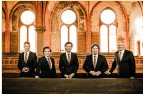
Ensemble amarcord

Zum krönenden Abschluss ist am 10. Oktober das weltberühmte Vokalensemble amarcord im Dom zu Gast. Unverwechselbarer Klang, atemberaubende Homogenität, musikalische Stilsicherheit und eine gehörige Portion Charme und Witz sind die besonderen Markenzeichen von amarcord. Das äußerst