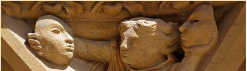
Ein Kapitell von der Kathedrale in Metz

Herzlich willkommen zu diesem besonderen Gottesdienst am Freitag, dem 6. März um 19.30 Uhr in der Landeskirchlichen Gemeinschaft im Grünen Winkel 5. Danach ist Zeit für Gespräch und Verkostung landestypischer Gerichte – und auch Gelegenheit, Produkte fairen Handels aus dem Weltladen kennenzulernen und zu kaufen. Herzliche Einladung!