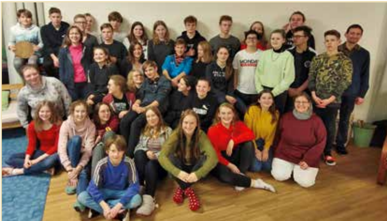
Die Woche gemeinsamen Lebens 2020

„Er erquicket meine Seele. Er führet mich auf rechter Straße um seines Namens willen.“ Psalm 32,3