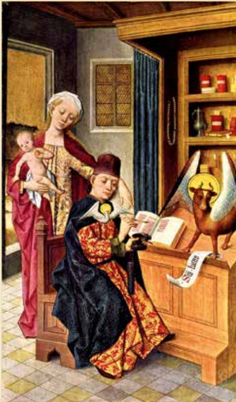
Inspiration des Hl. Lukas (Hermen Rode 1484)

So wie die von der Güstrower Kantorei 2013 und 2016 aufgeführten Passionsmusiken nach Johannes und Matthäus von Heinrich Schütz (1585 bis 1672), ist auch seine Lukaspassion in den Jahren 1664 bis 1666 entstanden. Diese Kompositionen werden als Höhepunkte in seinem Schaffen angesehen.